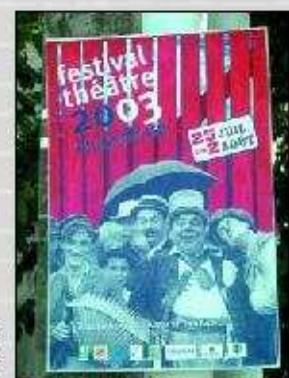
Affiche du festival de théâtre de Phalsbourg édition 2003